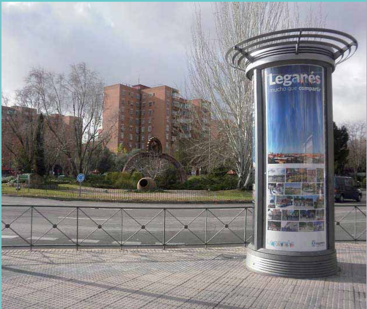
Plaza de la Noria